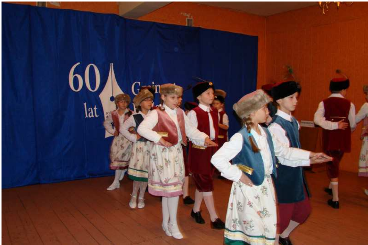
Występ dzieci z Publicznej Szkoły Podstawowej w Jedlińsku