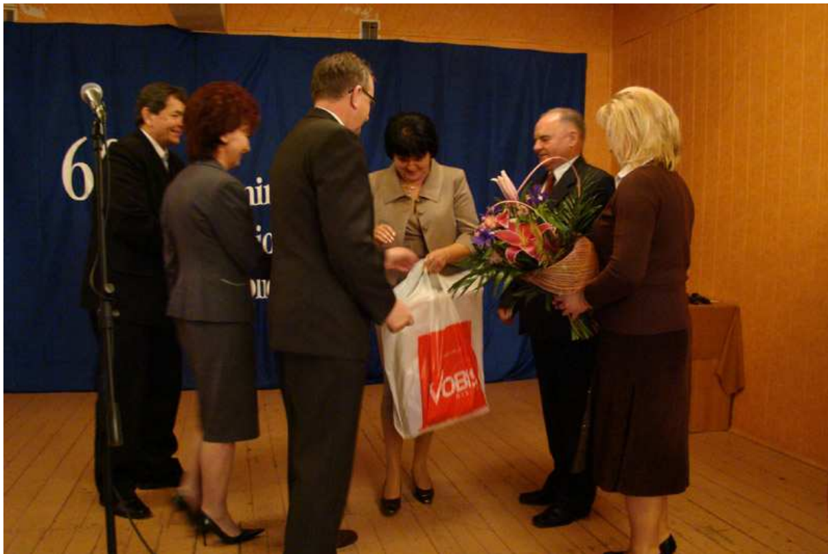
Władze Gminy Jedlińsk

Wartość jubileuszu to nie świąteczna gala, to zamknięty rozdział historii i nasze wspomnienie. Historia biblioteki to nie tylko imponująca liczba książek, czytelników, ale przede wszystkim troska o rozwój intelektualny i kulturalny naszej lokalnej społeczności.