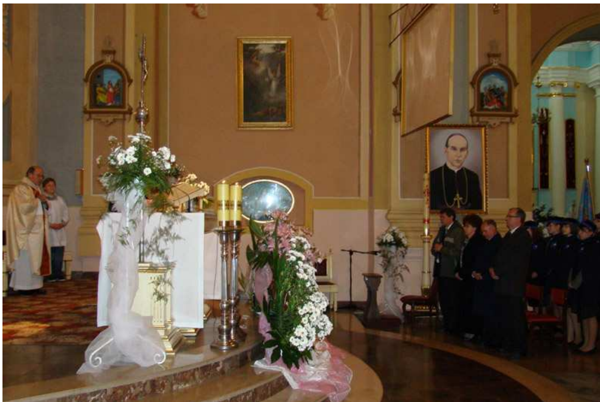
Msza Św. – Kościół pw. Św. Piotra i Andrzeja w Jedlińsku