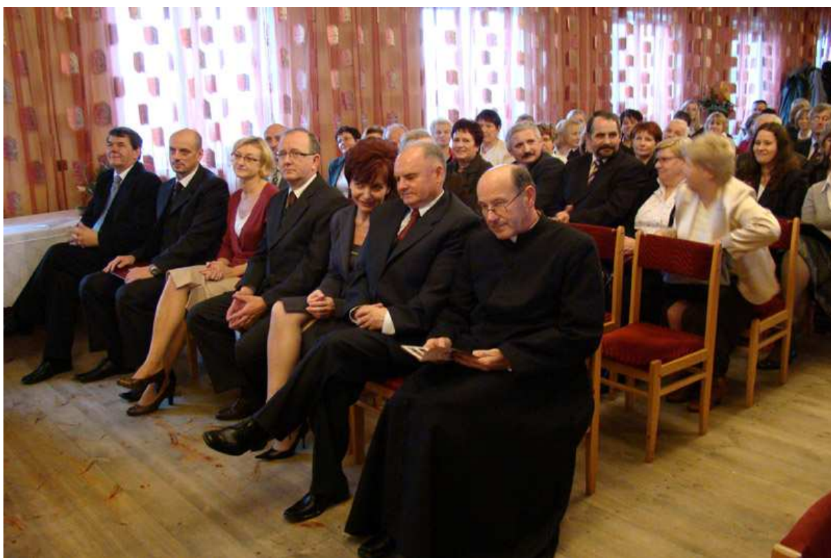
Zaproszeni goście na jubileusz 60-lecia Gminnej Biblioteki Publicznej w Jedlińsku